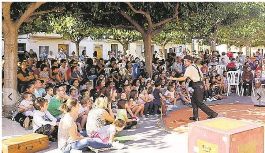
La Troupe Malabo acercó el circo a un público familiar muy entregado. - MIRA // BOU PER LA VILA

El encierro de 'Bou per la Vila' vuelve a congrega a cientos de personas en la Vila. 'Així canta Nules' reedita un formato de éxito con vecinos que se suben al escenario